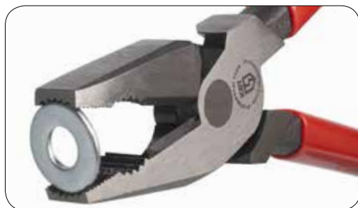
Насечка на челюстях пассатижей точно подогнана друг к другу, что позволяет прочно удерживать даже очень тонкие детали