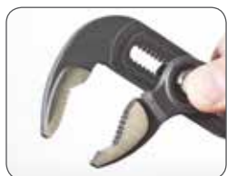
Пружинная кнопка для настройки