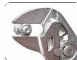
Оптимальная установка размера