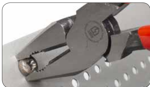
Безальтернативный инструмент для удаления заржавевших шпилек, болтов с круглыми головками, винтов со сложными или сорванными шлицами