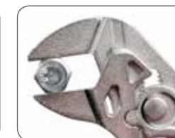
Захват хромированных деталей без повреждения