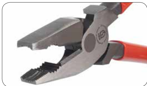
Специальный угол насечки позволяет работать с винтами со сферическими головками, в том числе – низкопрофильными