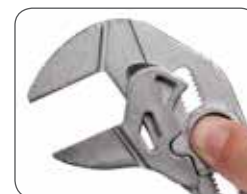
Пружинная кнопка для настройки