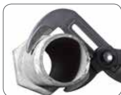
Большое раскрытие клещей для захвата