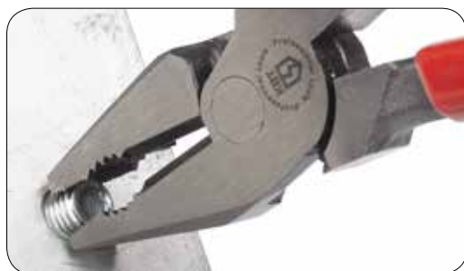
Благодаря вертикальным и горизонтальным насечкам, зубцы не проскальзывают на круглых деталях в процессе откручивания