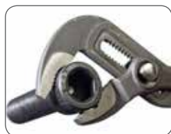
Захват круглых деталей