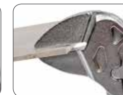
Захват плоских деталей