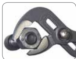
Оптимальная установка размера