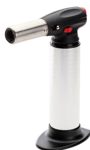
X-350 (KVT) портативная многофункциональная газовая горелка