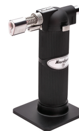
X-190 (KVT) портативная многофункциональная газовая горелка