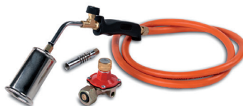
ПГ (KVT) пропановая горелка для монтажа термоусаживаемых муфт