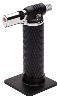
X-220 (KVT) портативная многофункциональная газовая горелка