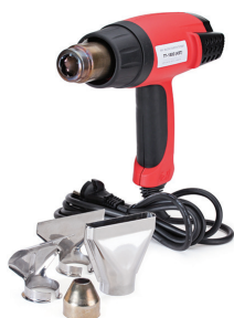
TT-1800 (KVT) высокотемпературный фен