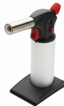
X-500 (KVT) портативная многофункциональная газовая горелка