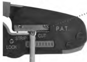
Модуль для разделки круглого провода