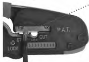
Модуль для разделки плоского провода

Пресс-клещи JT-04 состоят из корпуса и рукоятки. В корпусе расположен модуль для опрессовки, состоящий из двух встроенных матриц 6Р и 8Р, модуль для резки и разделки плоских и круглых проводов.