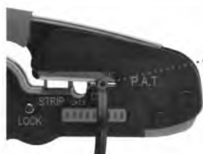
Модуль для резки провода